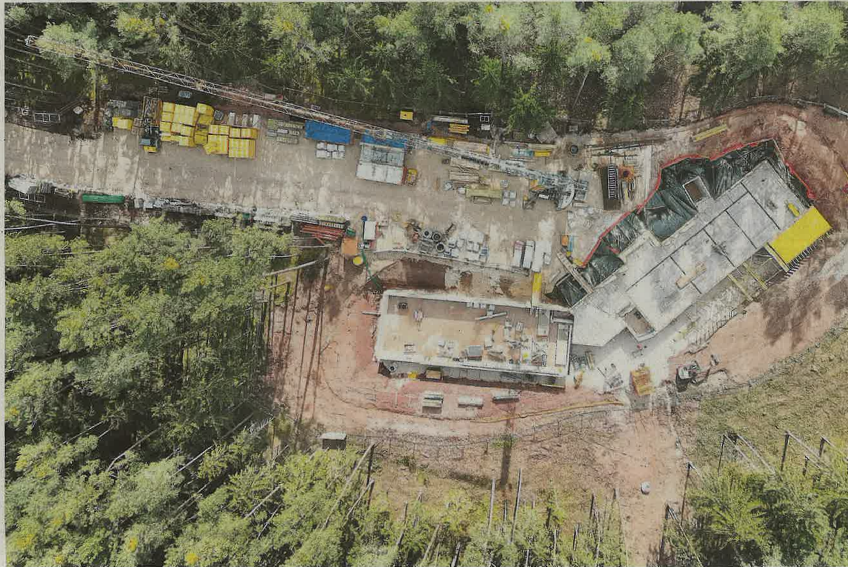
Die Baustelle des Hospiz am Brombachsee aus der Vogelperspektive.

Das Sockelgeschoss im Westflügel ist in den Hang gebaut. Noch stehen im Gang die Baustützen und am Boden das Wasser. Aber die Raumaufteilung ist schon sichtbar. Untergebracht sind hier, wo nur durch schmale Fensteröffnungen das Tageslicht fällt, im Wesentlichen die Funk-