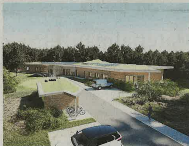
So soll die Zufahrt zum Hospiz aussehen.